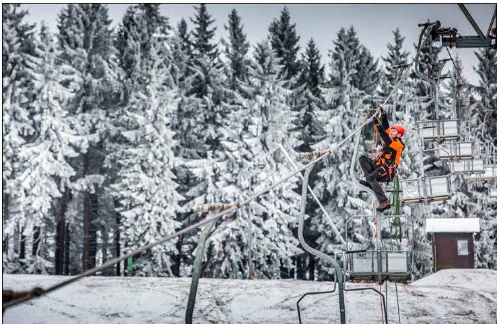
Na hasiče čeká v nadcházející lyžařské sezóně i řešení krizových situací na sedačkových lanovkách. Proto je nutné na takové zásahy intenzivně trénovat.