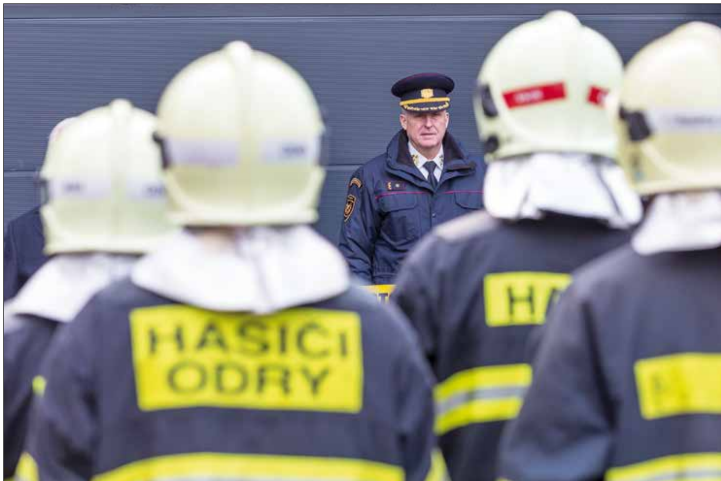
Dobrovolní hasiči v Odrách se po více než dvou letech dočkali nové hasičské zbrojnice. Dočtete se na str. 6.