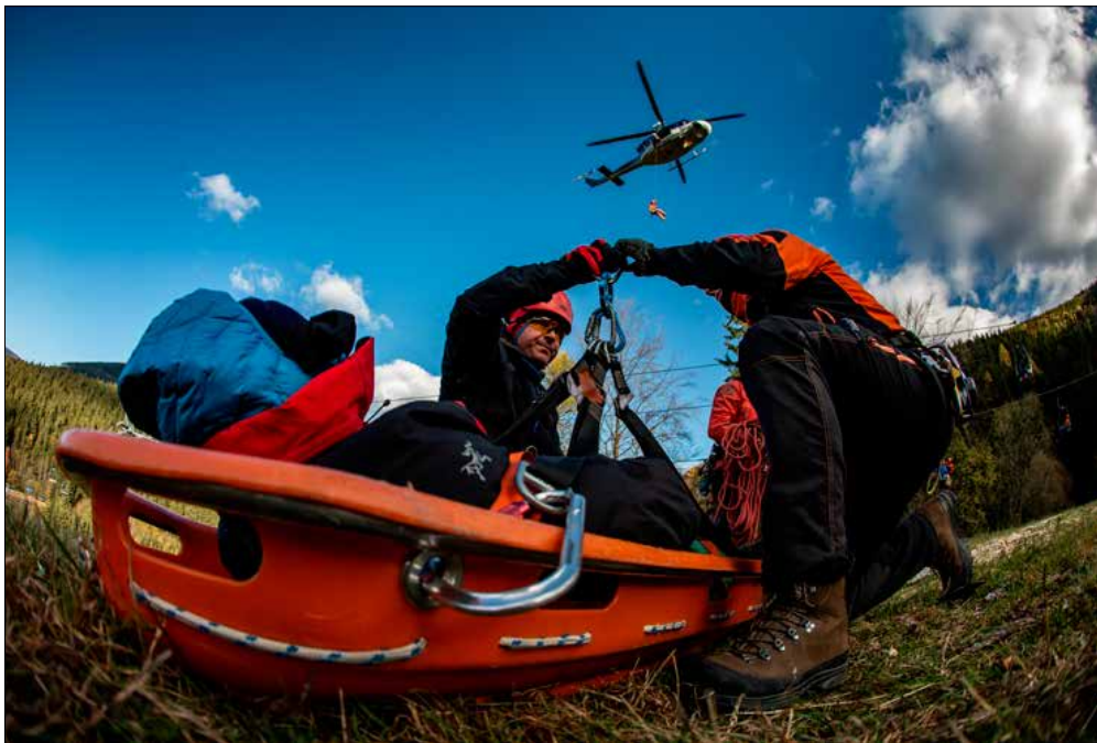
Záchrana osob pomocí vrtulníků ve spojení s lanovou technikou je v České republice, respektive v rámci Hasičského záchranného sboru České republiky systematicky cvičena a využívána od roku 1997.

MSMT MINISTERSTVO ŠKOLSTVÍ, MLÁDEŽE A TĚLOVÝCHOVY