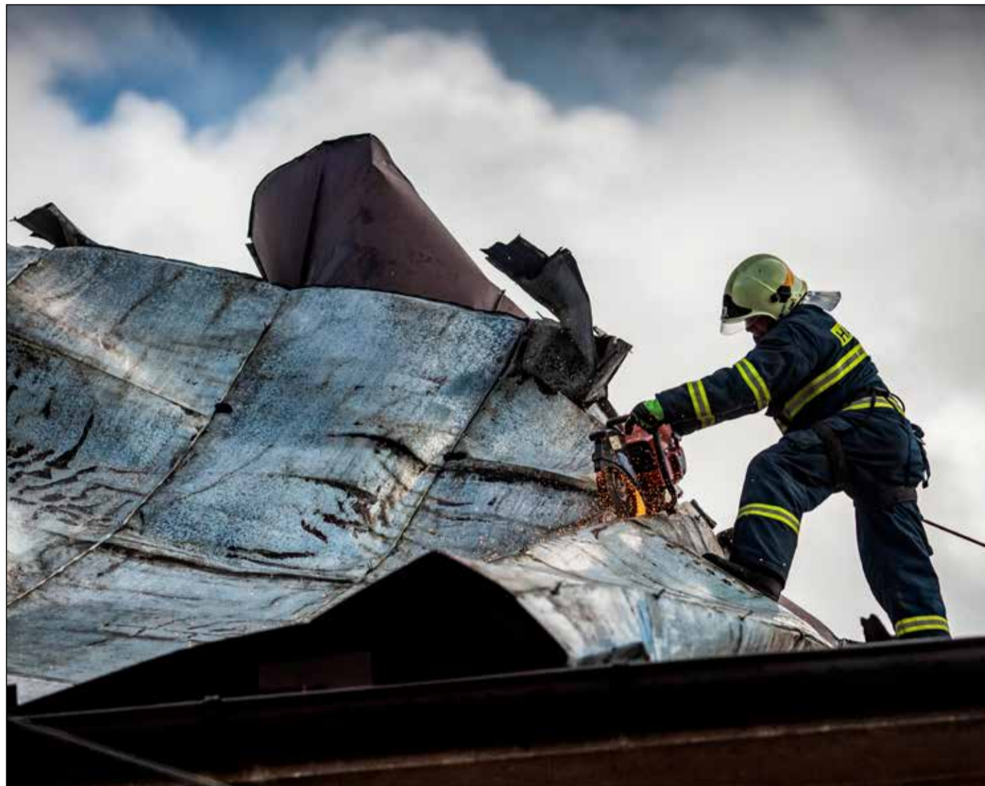
Větrné bouře Sabine a Dennis. Tlaková níže Julie: spousta práce pro hasiče!